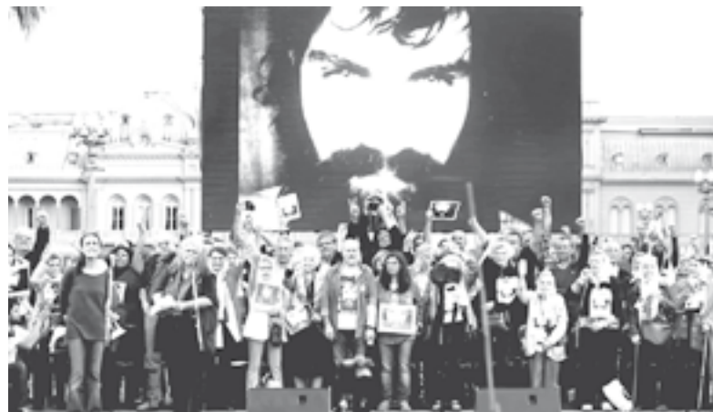
El Camino de Santiago. Desaparición y muerte de Santiago Maldonado.

“Mi obra cinematográfica está vinculada siempre a la historia y a la cultura argentinas. Desde la forma de la ficción o desde el documental he abordado temas como Malvinas, Borges, Cortázar, El Che o lo acontecido con el cadáver de Eva Perón, entre otros. Pero siempre he tenido ese prisma que solo te da el tiempo para reflexionar y emprender la obra.”