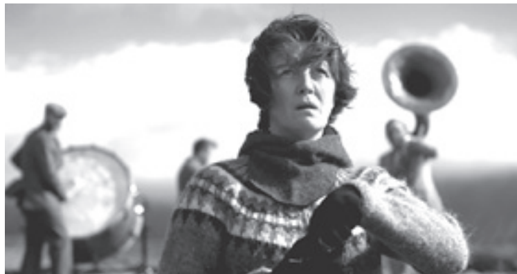
Woman at War.

Dinamarca está representado por That Time of Year ( Den tid på året , 2018) en el que la afamada actriz Paprika Steen –musa del movimiento Dogma 95 por su labor en Los idiotas y La celebración –,