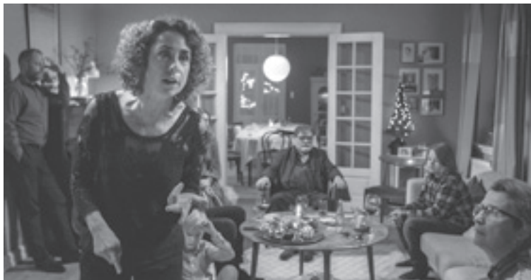
That Time of Year.