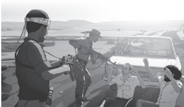
Another Day of Life.