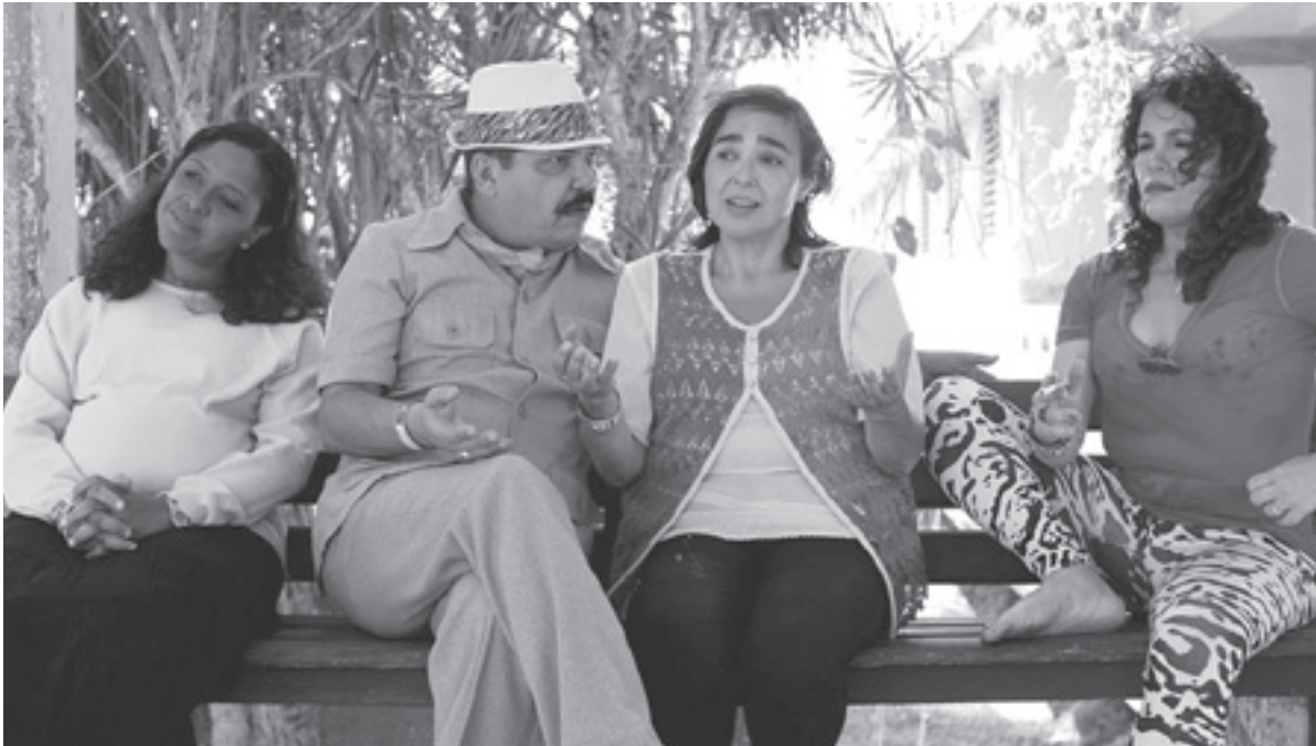
El viaje extraordinario de Celeste García es una película que retrata las preocupaciones de la sociedad moderna cubana.