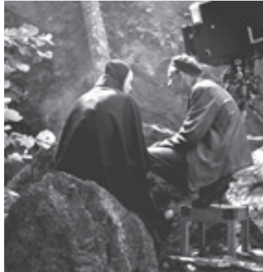
Bergman, un año, una vida , de Jane Magnussom (Suecia).