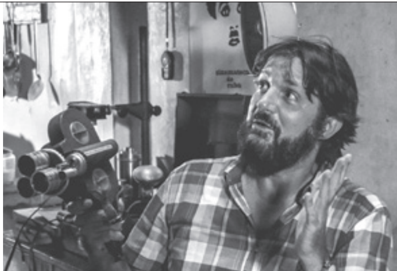
Nido de mantis , la más reciente cinta del director cubano Arturo Sotto resultó galardonada con un Coral especial en esta edición 40 del Festival.

En el cine y la literatura existen innumerables variaciones de triángulos amorosos como ex-