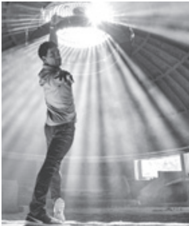
Yuli, de Iciar Bollain (España).

Y COMO TODO LO QUE COMIENZA termina, llegamos al final de esta fructífera y abundante edición del Festival a la altura de sus jóvenes cuarenta años. La luneta... ofrece, tal su costumbre, los premios en la especialidad que la estructura: lo que no compite, pero sí colma las expectativas de muchos. Aquí van los corales lunetarios: