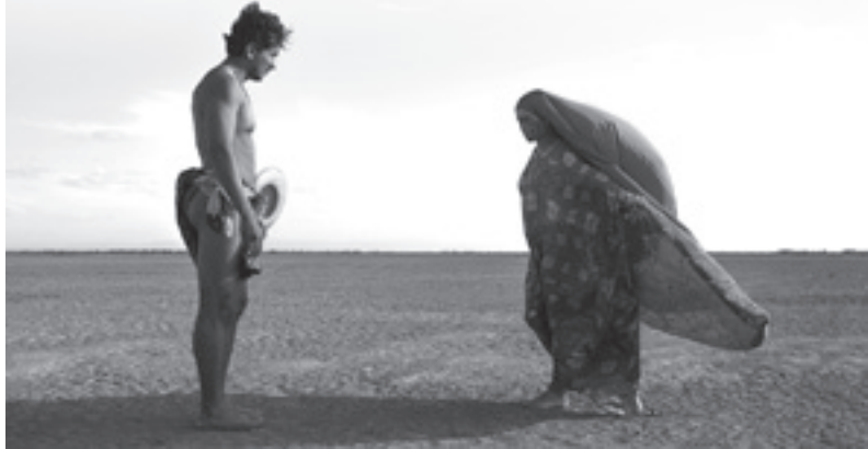
Pájaros de Verano.