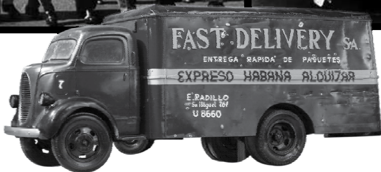
IMAGEN IC CONTEMPORANEA